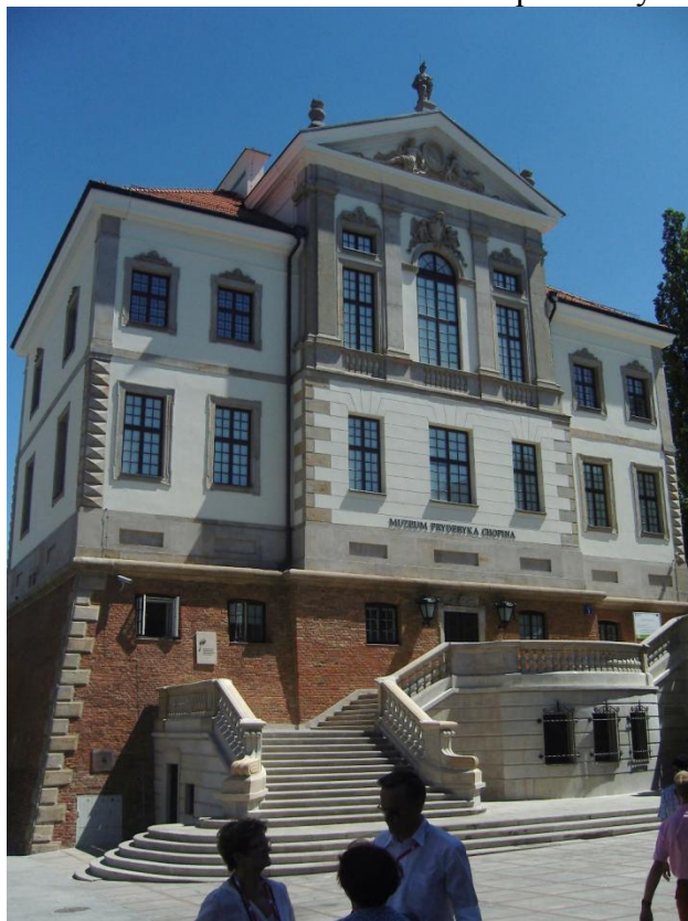
Центральный вход Музея Фредерика Шопена. 2012 г.

Оригинальные экспонаты, личные предметы Ф. Шопена органично включены в экспозиционное пространство музея и в совокупности с широким рядом аудиовизуальных и интерактивных приложений, позволяют в полной мере познакомиться с гением польской и мировой музыки.